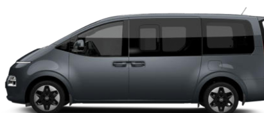
Graphite Gray Metallic