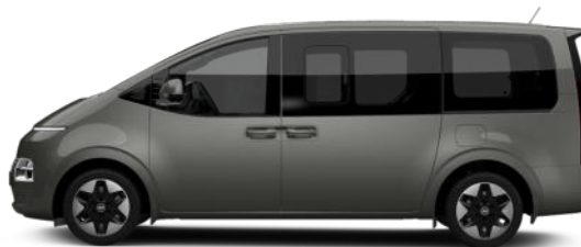
Olivine Gray Metallic nur für Bus verfügbar